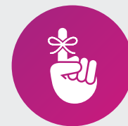
您在 Ambetter HMO Individual & Family Plan 網絡中。

如欲在您的 Ambetter HMO 網絡中尋找緊急照護中心，請瀏覽 myhealthnetca.com 並按一下「Find a Doctor」（尋找醫生）。